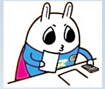
東京地方税理士会 イメージキャラクターの「トッチーくん」